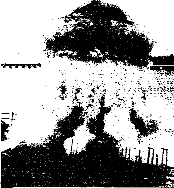
مفاعل نووي في باكستان ، وهو المفاعل الذي سيصنع فرنسا لباكستان .

وهيما يكن الامر فالواقع هو ان اميركيين فننوا السيطرة على صناعة الذرة في الاغراض السلمية . وتسددا العالم الثالث يخلص من نظارة المصنف التكنولوجية ويمتلك نقاط قوة تكون احياها اكبر من طاقته ، ولكن هذا العالم يدرك ان البقاء لا تقوى .